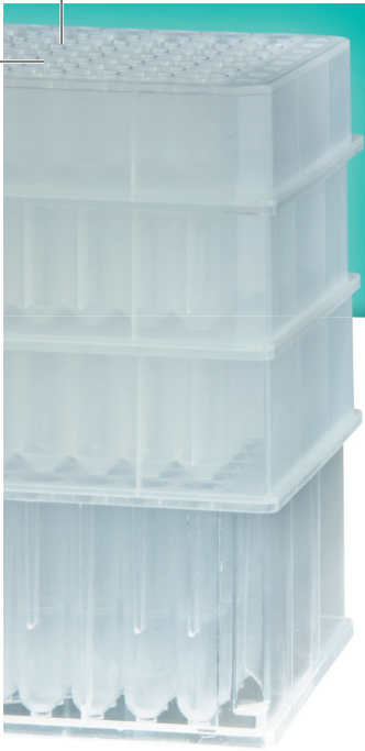
Riplate medio 0,5 ml