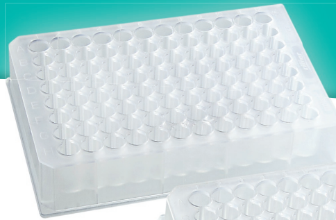
Riplate medio 1 ml