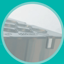
Riplate Plus mit Luftschleusen und Randanhebung der Wells