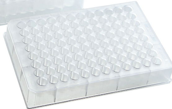
Riplate medio 0,5 ml